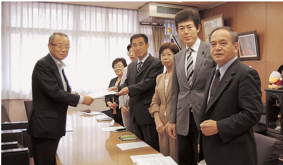
5月20日区長に申し入れする日本共産党区議団

5月23日臨時区議会で議会人事がきまりました。日本共産党区議団は「第一会派から議長、第二会派から副議長、第三会派から監査などのルール作りを」と主張しましたが、他会派は拒否しました。その結果、議長は自民党、副議長は公明党に。監査は第三会派である日本共産党ではなく第